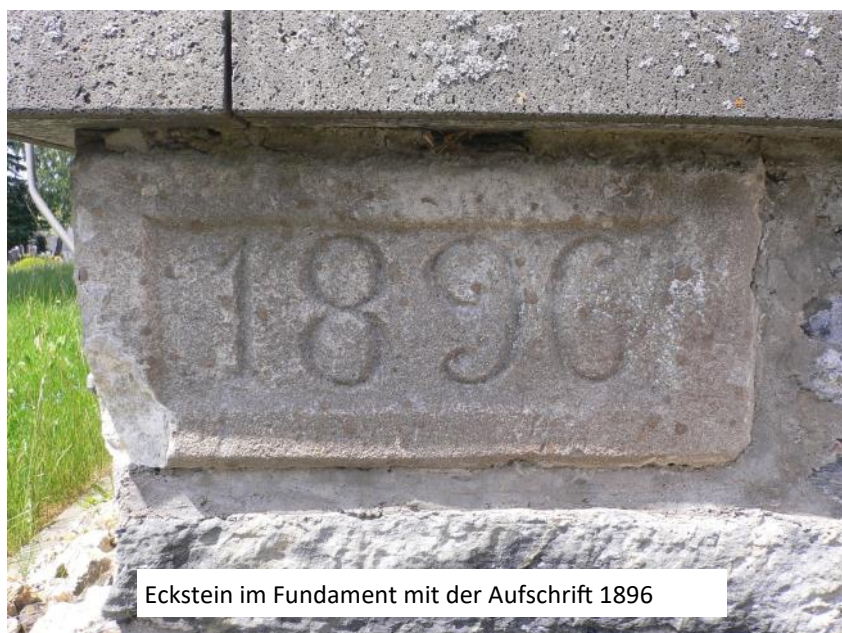
Eckstein im Fundament mit der Aufschrift 1896