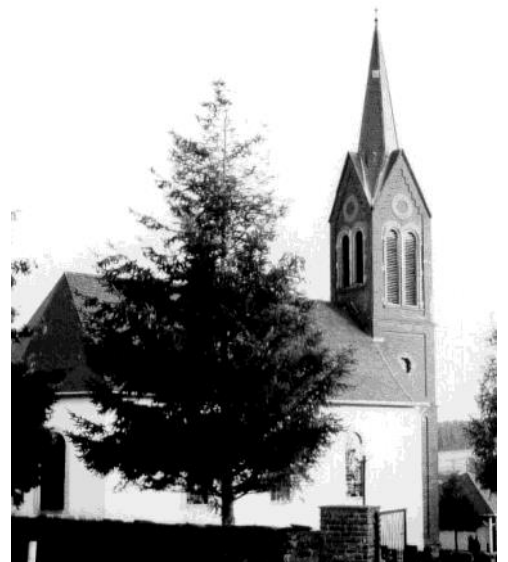
Glockenturm aus Feldbrandziegeln (1987)

„Glockenaktion“ im Zweiten Weltkrieg zum Opfer fiel. Pfarrer Richard Oertel (* 1860. +1932), ev. Pfarrer von Neuerkirch-Biebern von 1886 bis 1930, war der Initiator für den Neubau. 1989 wurde der aus Backsteinen errichtete Turm verputzt und mit einem weißen Anstrich versehen. Nun hatten beide Kirchen einen weißen Anstrich und dominieren seither das Ortsbild. Eine deutliche Aufwertung erhielt das Ortsbild durch die Anstrahlung beider Kirchen. Nach versuchsweiser Anstrahlung im Herbst 1996 wurden die Strahler installiert und seit Januar 1998 werden beide Kirchen in den Abendstunden angestrahlt. Die Illumination beider Kirchen ist im gesamten Biebertal zu sehen und ein besonders schöner Anblick.