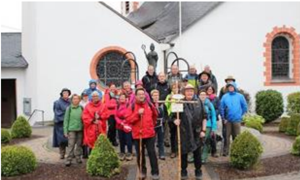
Start der Pilgergruppe in Halsenbach um 06:00 Uhr