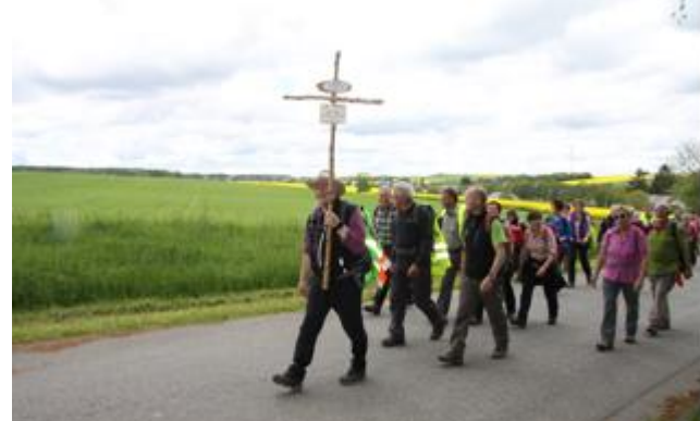
Die Pilgergruppe auf dem Weg zum ersten Etappenziel Kirchberg

Aus verschiedenen Ortschaften schließen sich immer wieder neue Pilger an, so dass die Gruppe teilweise mehr als 60 Personen umfasst.