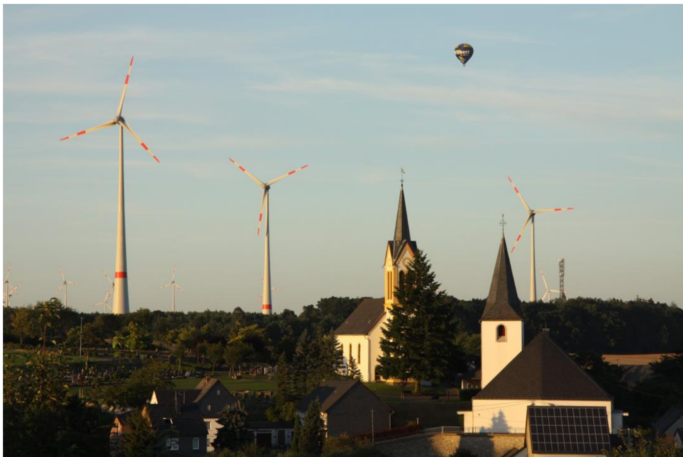
Bericht auf Seite 2.