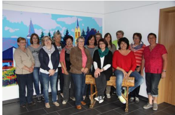
Grüne Hölle am Sportplatz