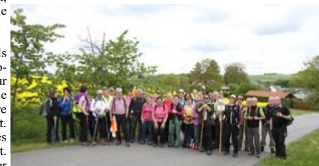
Die Pilgergruppe auf dem Weg zum ersten Etappenziel Kirchberg

Anm. Redaktion: Der Artikel sollte schon in der vorigen Ausgabe erscheinen.