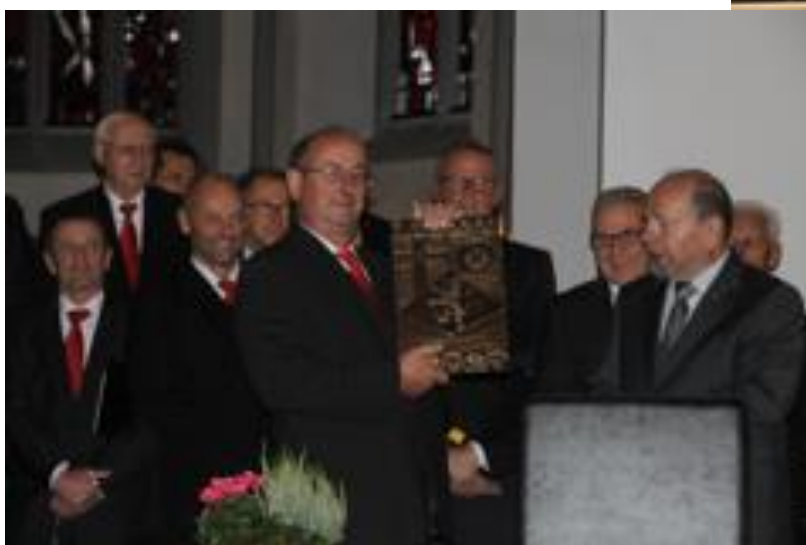
Überreichung des Wappenschildes durch den Ersten Beigeordneten des Rhein-Hunsrück-Kreises, Reinhard Klauer